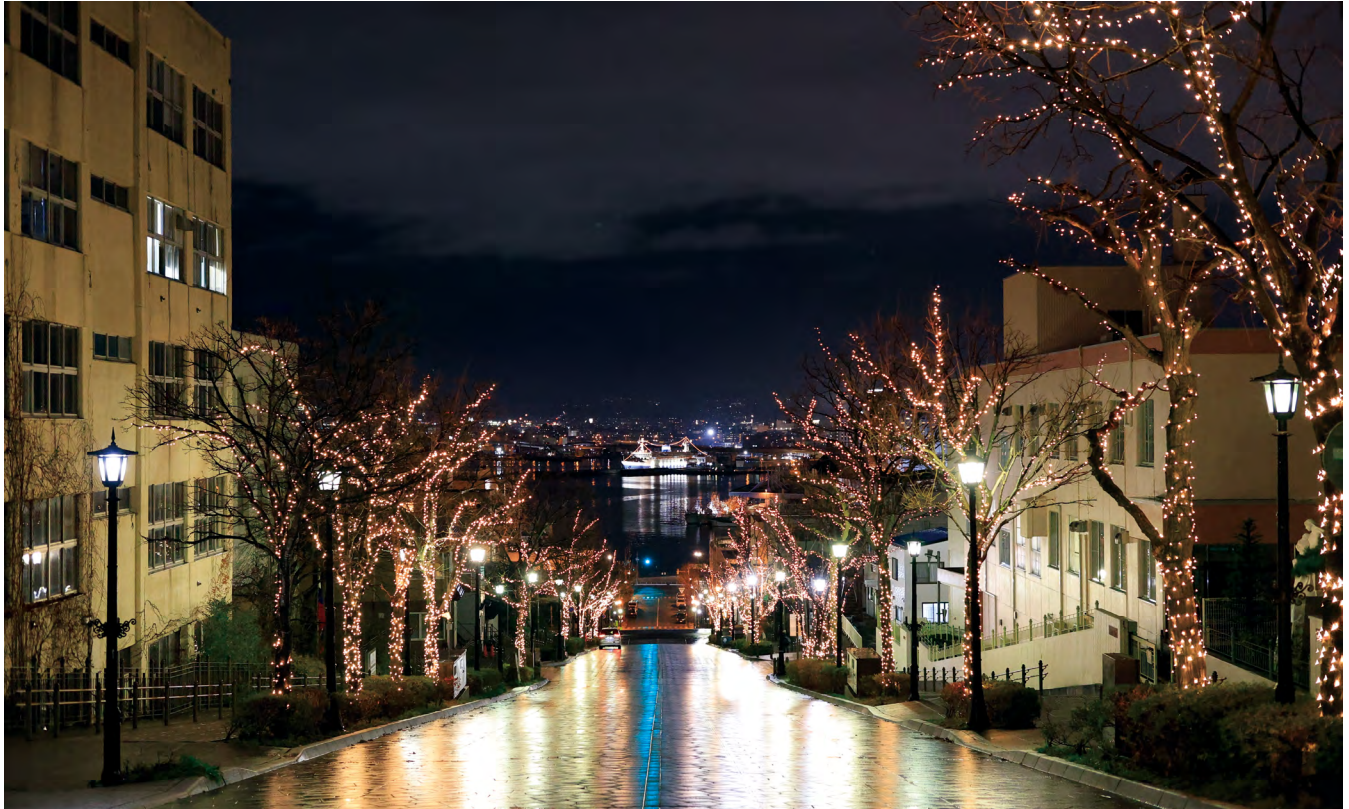
今年度の八幡坂のイルミネーション